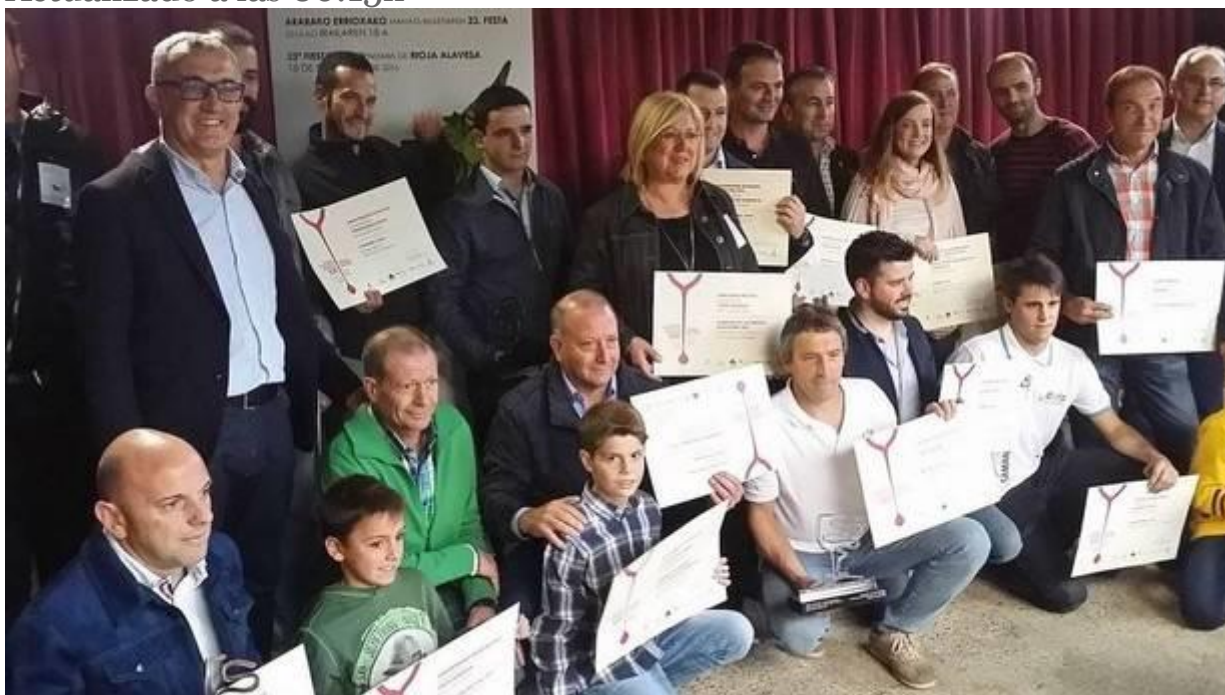
Foto de familia de los premiados.